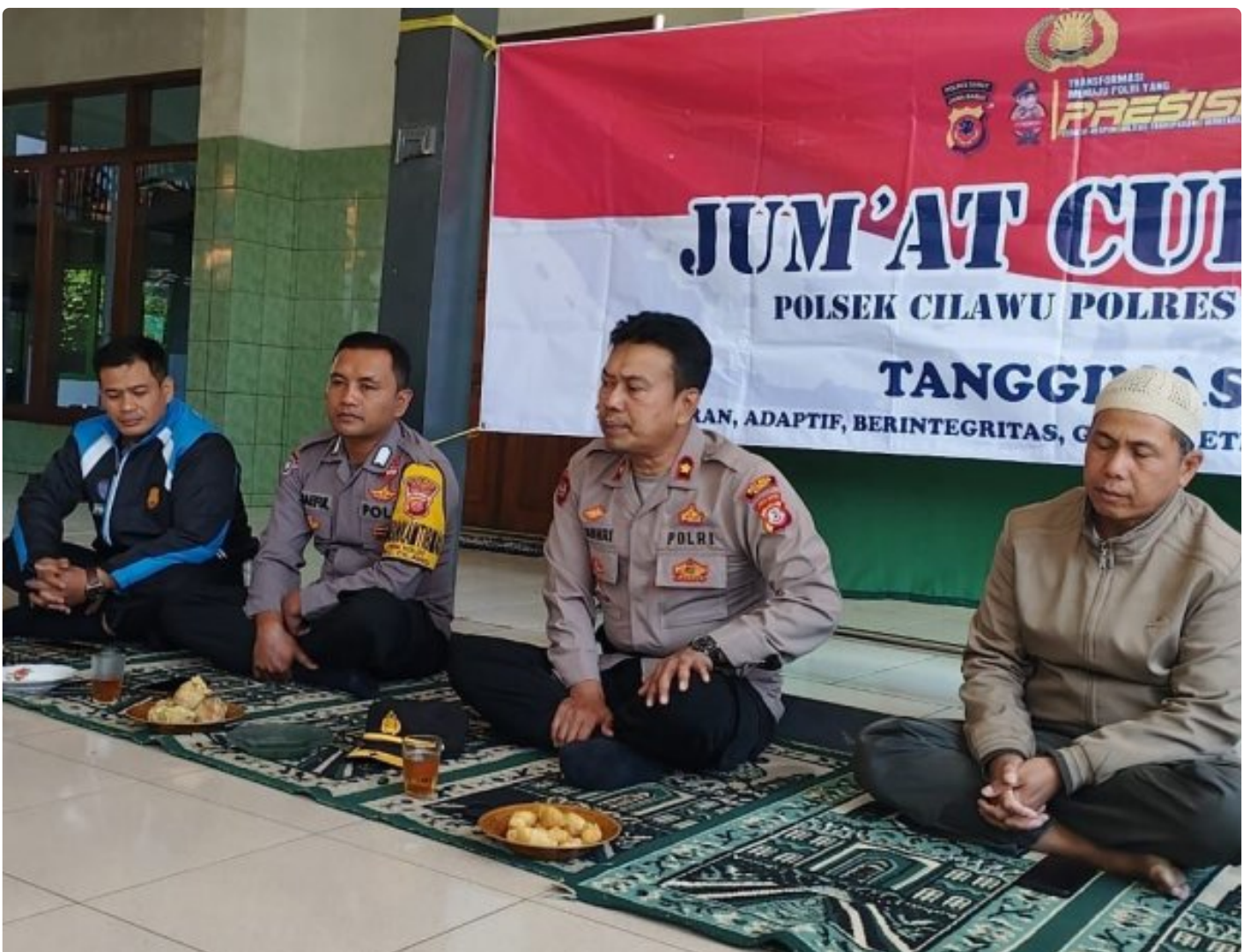
Kapolsek Cilawu mendengarkan curhatan warga